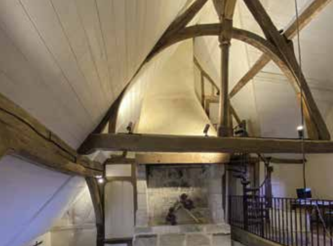
La grande salle sous charpente, et cheminée ajoutée lors de l'insertion d'un plancher intermédiaire.