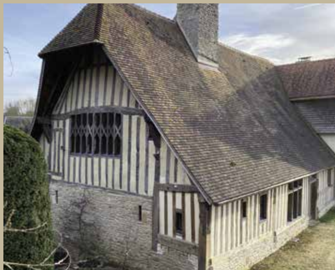
A l'angle nord-ouest, fenêtres de la chambre seigneuriale, et porte de la latrine.

Il est l'auteur de nombreuses études sur les architectures de bois.