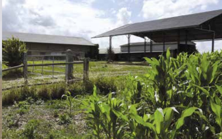
Ferme à Tilly-la-Campagne, architecte Pierre Orième.

Du grand chantier de la Reconstruction, il reste un important patrimoine construit.