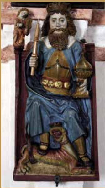
Statue de saint Olaf datant du XIII e siècle. Elle orne une église d'un village suédois nommé Sankt Olof, en son hommage.