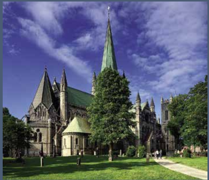
Cathédrale de Trondheim ( Nidarosdomen). Les reliques de saint Olaf y sont conservées.

Cette conférence reviendra donc sur ce double aspect de saint Olaf, inspiré par un ferveur qui lui vaudra d'être canonisé mais également par un caractère belliqueux rappelant son passé viking.