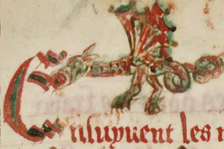
Détail du dragon en marge supérieure, f° 36v, 1518

L'étude de ces images et la mise en valeur de leur variété permettra de montrer comment un simple registre peut être aussi le témoin de l'évolution des goûts, des modes et plus profondément des transformations sociales et/ou culturelles du milieu du XV e siècle à la fin du XVII e siècle.