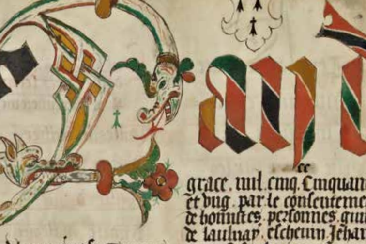
Lettrine, f° 52, 1549