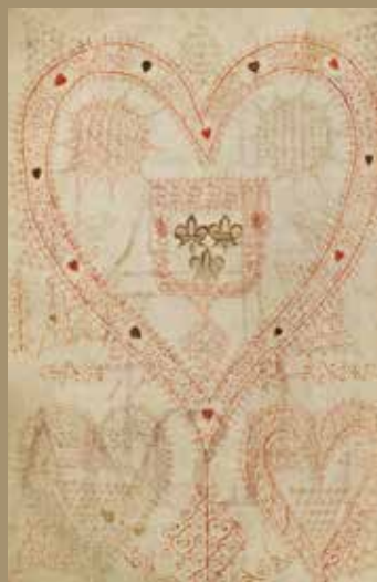
Cœur et trois fleurs de lys, f° 86v, 1628