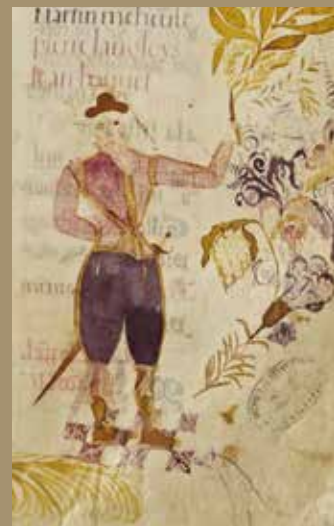
Portrait, f° 71, 1571