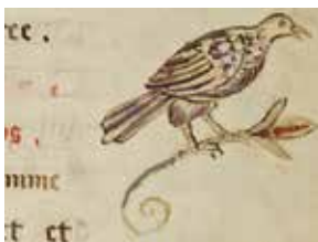
Décor marginal, détail.