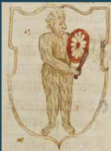
Homme sauvage, f° 63, 1586

L'église Saint-Nicolas, comme la plupart des paroisses caennaises, accueillait une confrérie à buts religieux et caritatifs, appelée Charité . Ces sociétés tenaient un registre de leurs membres, le matrologe : c'est ce manuscrit, conservé aux Archives du Calvados, qui sera présenté lors de cette conférence. Le Matrologe de la Charité Saint-Nicolas commence en 1452 et se termine en 1789 ; il se caractérise par une exceptionnelle décoration. En effet, chaque page – ou presque – est illustrée de décors issus de la vie quotidienne, ou témoignant des modes iconographiques ou esthétiques des différentes époques ; certaines images sont liées à des évolutions sociales ou culturelles ; d'autres, plus rares, semblent être de discrètes allusions au contexte historique contemporain.