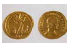
13 Solidus et demi de Constance II (337-361) frappé à Nicomédie, Frénoville (Calvados) Caen, musée de Normandie