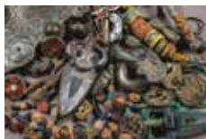
2 Parures des VI e et VII e siècles.