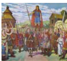
5 Planche didactique : Clovis, élevé sur le pavois Editions M.D.I., Saint-Germain-en-Laye, Imp. Daniel Liévin, Lille ; vers 1970 Collection privée