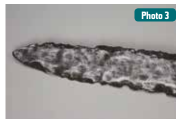
Épée en fer damassé (détail), Frénouville (Calvados), v e s. Caen, Musée de Normandie.

musee-de-normandie.fr f /MuseedeNormandie @MuseeNormandie #ExpoBarbares