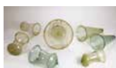
16 Verreries, plaine de Caen, première moitié du VI e siècle. Caen, Musée de Normandie