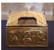
4 Chrismale de Mortain (Manche), cuivre travaillé au repoussé et doré sur âme en bois, réalisée en Angleterre, vers 660-725 Mortain-Bocage, collégiale Saint-Évroult.