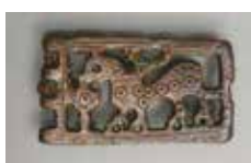
6a 6b Plaque-boucle à l'hippogriffe en bronze, Cherbourg-en-Cotentin (Manche), fin du VI e ou première moitié du VII e siècle.