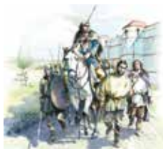
1 Illustration © Musée de Normandie – Ville de Caen / O. Nadel