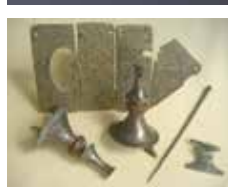
12 Saint-Vigor-le-Grand, nécropole de Pouligny, plaques de ceinturon masculin et parures féminines, témoins de la culture romano-germanique diffusée en Gaule du Nord par l'armée romaine, IV e s. Bayeux, Collection du MAHB