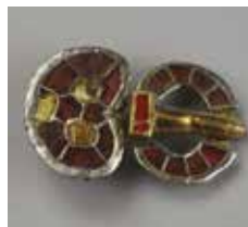
10 Plaque-boucle en argent et bronze doré à décor de verroteries cloisonnées, Frénoville (Calvados), début du VI e s. Caen, Musée de Normandie