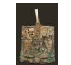
7 Seau en bois d'if à monture de bronze présentant un décor estampé, nécropole de Giberville (Calvados), début du VI e siècle. Caen, musée de Normandie