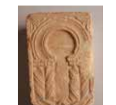
8 Claveau à décor d'arcature, pierre calcaire, ancienne abbaye d'Evrecy (Calvados), dernier tiers du VII e siècle. Caen, Musée de Normandie