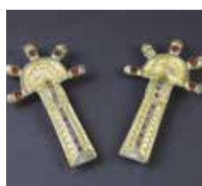
11 Fibules digitées en argent, argent doré et verroteries, Saint-Martin-de-Fontenay (Calvados), début du VI e siècle. Caen, musée de Normandie