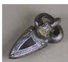
14 Plaque-boucle de ceinture en bronze et tôle d'argent à décor niellé, Réville (Manche), fin du VI e - début du VII e s. Caen, Musée de Normandie