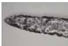
3 Epée en fer damassé (détail), Frénoville (Calvados), VI e s. Caen, Musée de Normandie