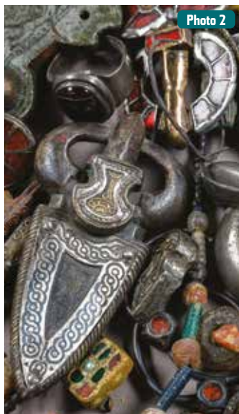
Parures des v e et vi e s.

Qui sont les barbares dont l'installation en Gaule marque la fin de l'Antiquité romaine et le début du Moyen Âge ? Leur installation en Gaule marque-t-elle vraiment le début d'un âge sombre ou au contraire inaugure-t-elle un âge nouveau, fruit du mélange entre les cultures ?