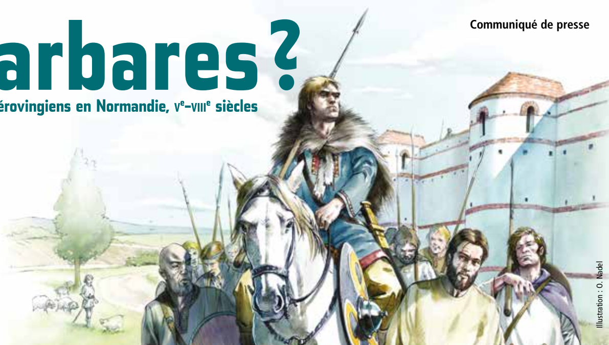
Illustration : O. Nadei

La nouvelle exposition-événement du musée de Normandie nous invite à un voyage dans le temps... à la rencontre des Mérovingiens. Plus de 900 objets, pour la plupart inédits, y illustrent 4 siècles de notre histoire du v e au milieu du viii e siècle.