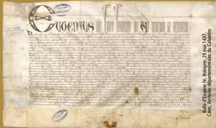
Bulle d'Eugène IV, Bologne, 29 mai 1437. Caen, Archives départementales du Calvados