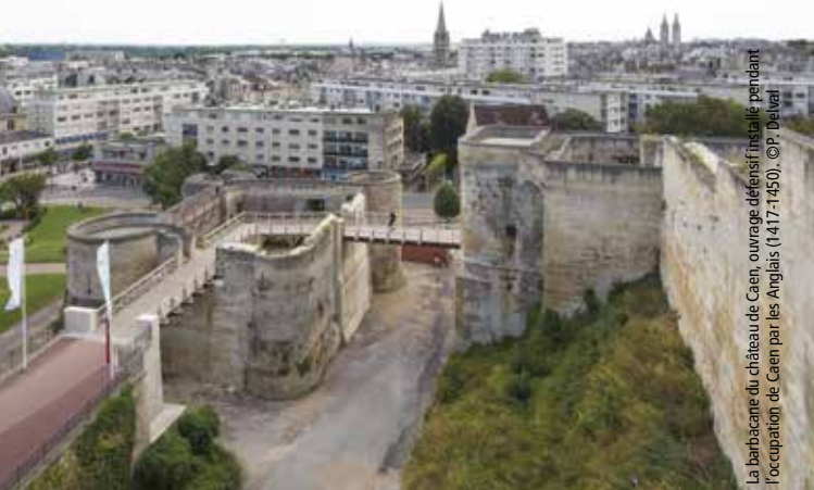
La barbicanne du château de Caen, ouvrage défensif installé pendant l'occupation de Caen par les Anglais (1417-1450).