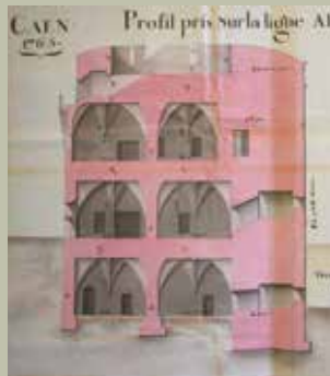
Coupe verticale de la tour Châtimoine, 1765.