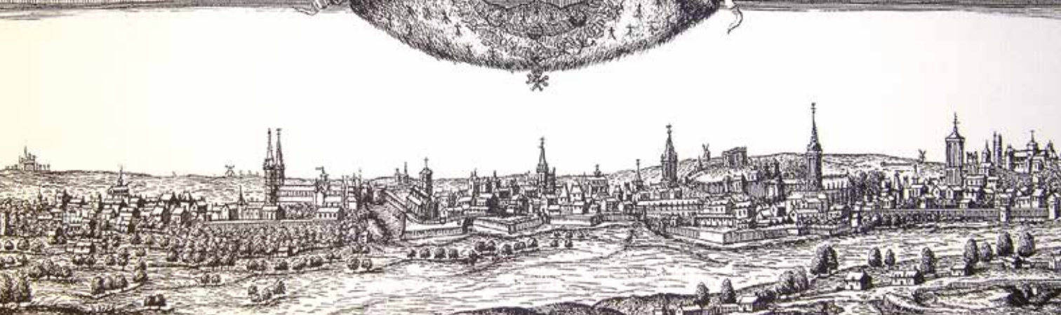
Détail du plan Cadomus , par Gomboust / Haince / Bignon (1672) [BNF].