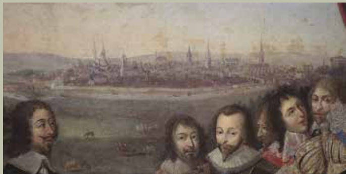
Louis XIII reçoit les clefs de la ville de Caen [huile sur toile (détail), vers 1620-1630, Abbaye aux Hommes]

En l'appréhendant sous divers angles, nous tenterons de redonner corps à cette clôture « fantôme », dont la matérialité passée paraît avoir été consubstantielle à l'identité citadine.