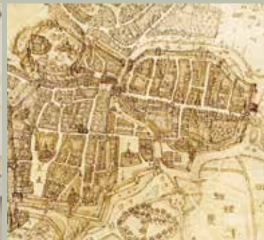
« Plan de la Ville et Université de Caen, Capitale de la Basse Normandie », (sic) ca 1665-1670