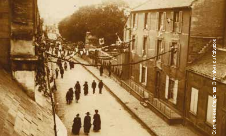
Caen, rue des Chanoines