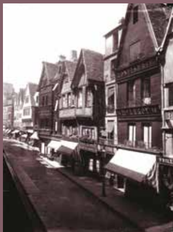
Caen, rue Saint Pierre.

La Grande place Saint-Gilles et la Petite place Saint-Gilles viendront clore ce parcours près de l'Abbaye-aux-Dames.