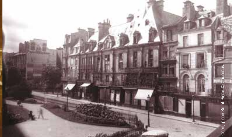
Caen, place Saint-Pierre